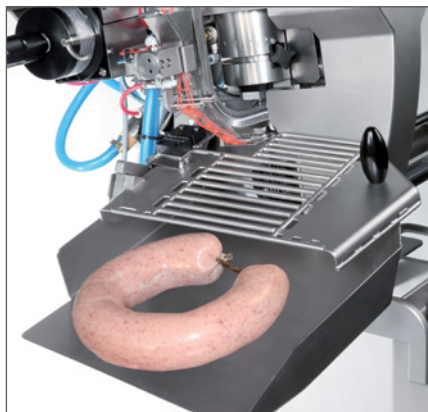
Speziell für Ringprodukte wie Fleischwurst, Ringsalami, Blut- und Leberwurst.