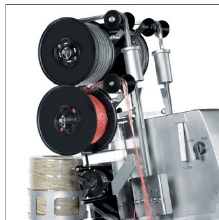
Spulenclips, Bandschlaufen und Fadenspender für eine effiziente Produktion.