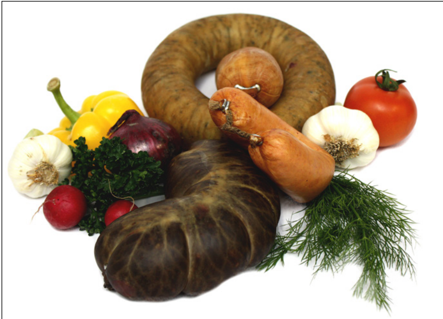
Naturdarmwürste mit Flachclipsen