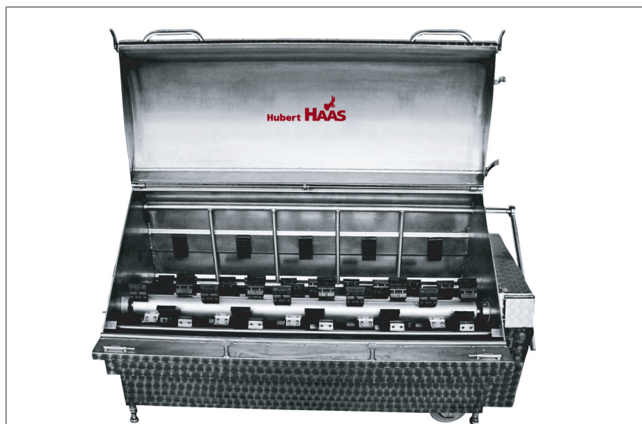
Typ H(N)MR oder H(N)ML